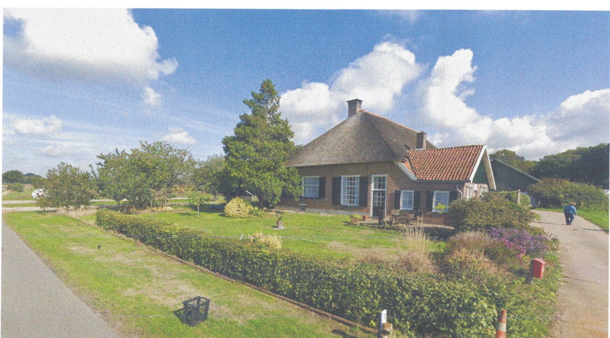
Essen, kampen & erven