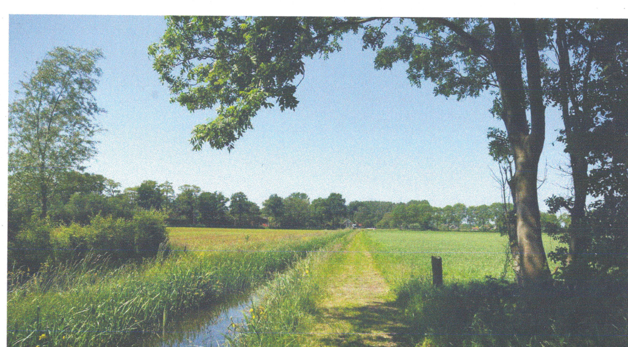
De lage broeklanden