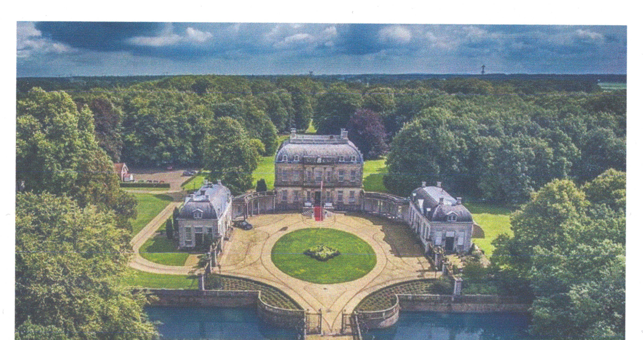
Landgoederen & bossen