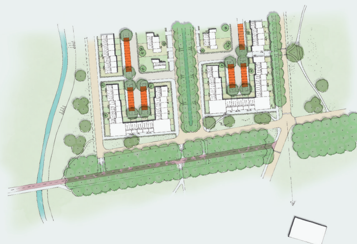
Het parkeren wordt ingericht op het achtererf, uit het directe zicht vanaf de lanen.