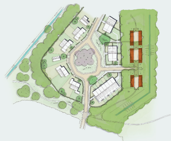
Parkeerplaatsen langs de randen van de erven, zodat het erf autoluw wordt.

De meeste vragen die u stelde gaan over de ontsluiting, de type woningen, mogelijkheden voor het combineren van varianten en parkeren. Deze vragen en opmerkingen nemen we mee in het verdere proces.