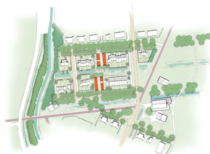
Parkeerplaatsen in kleine blokken tussen de woningen.