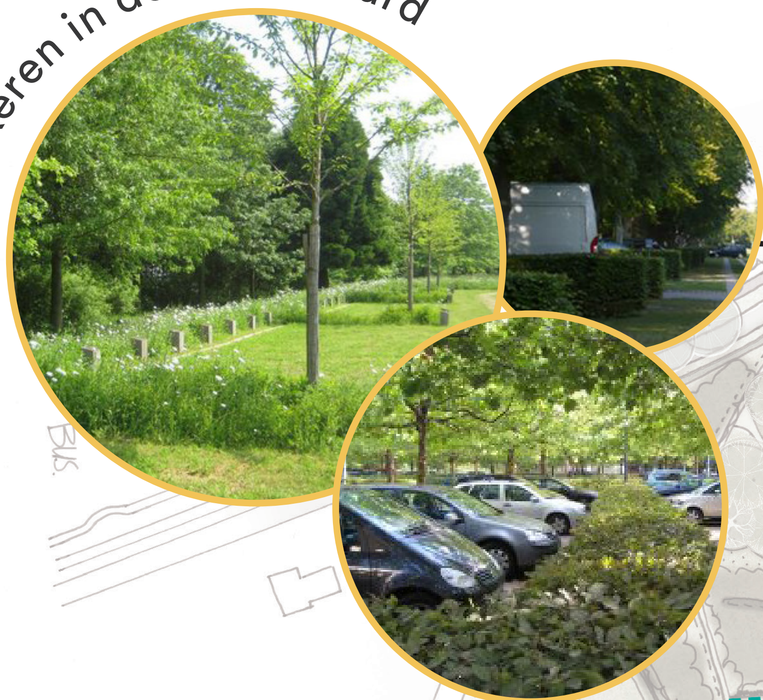
Parkeren in de boomgaard